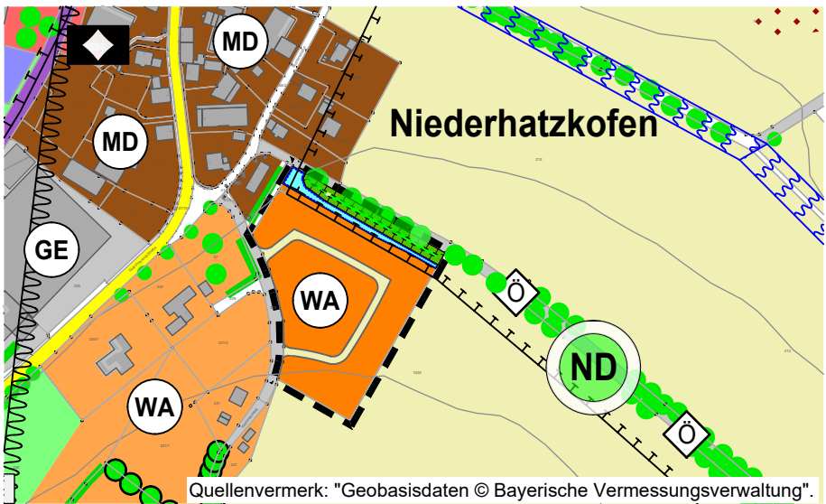
Flächennutzungsplan der Stadt Rottenburg a. d. Laaber, 18. Änderung